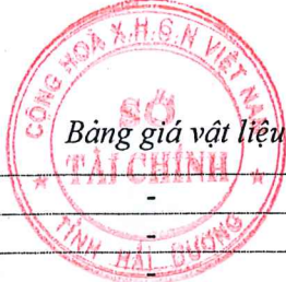
Bảng giá vật liệu xây dựng công bố tháng 8 năm 2020 tại Hải Dương