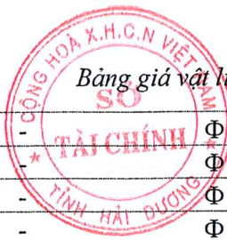
Bảng giá vật liệu xây dựng công bố tháng 8 năm 2020 tại Hải Dương