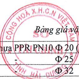
Bảng giá vật liệu xây dựng công bố tháng 8 năm 2020 tại Hải Dương