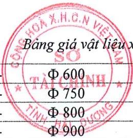
Bảng giá vật liệu xây dựng công bố tháng 8 năm 2020 tại Hải Dương