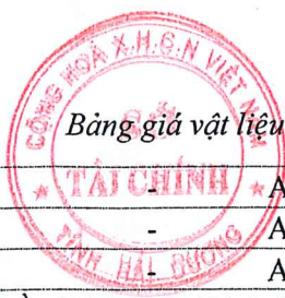
Bảng giá vật liệu xây dựng công bố tháng 8 năm 2020 tại Hải Dương