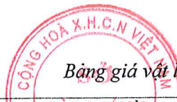
Bảng giá vật liệu xây dựng công bố tháng 8 năm 2020 tại Hải Dương