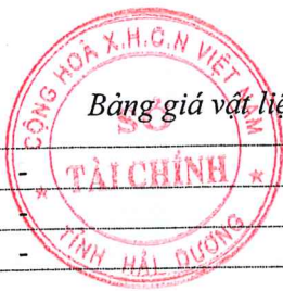
Bảng giá vật liệu xây dựng công bố tháng 8 năm 2020 tại Hải Dương