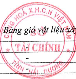
Bảng giá vật liệu xây dựng công bố tháng 8 năm 2020 tại Hải Dương